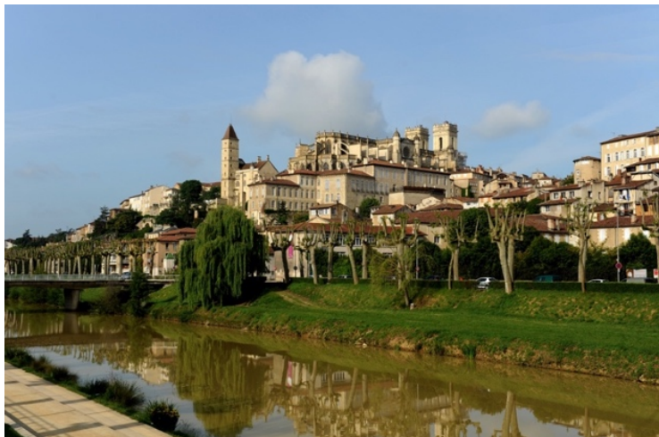
Panorama de Auch chemin d'Arles