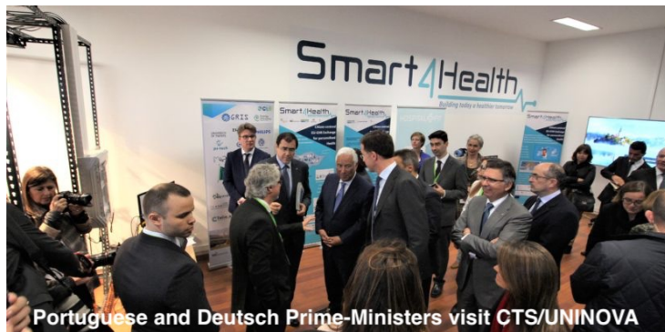
Portuguese and Deutsch Prime-Ministers visit CTS/UNINOVA

El objetivo principal de UNINOVA es buscar la excelencia en la investigación científica, el desarrollo técnico, la formación avanzada y la educación. Trabajando en estrecha colaboración con la industria y las universidades, las innovaciones tecnológicas se transfieren a conceptos empresariales rentables y, los productos existentes se desarrollan aún más para adaptarse a los nuevos requisitos industriales. Debido a su estrecha conexión con la Universidad y Madan Parque, UNINOVA ha acogido y apoyado desde su fundación el desarrollo de varias tesis doctorales, así como la creación de varias empresas de éxito.