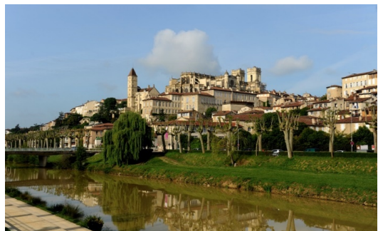
Foto: Paysage Auch chemin d'Arles ACIR Compostelle.