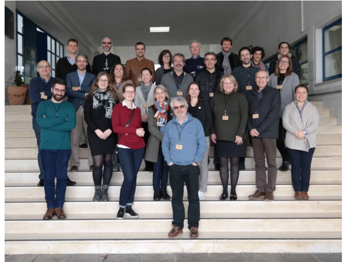
Foto del team di progetto al Kick-off meeting di Lisbona (IMPACTOUR)

Durante i due giorni dell'incontro tutti i partner hanno presentato e discusso il programma di lavoro, assicurando un buon avvio del progetto triennale. All'insaputa di tutti noi, il nostro incontro di fine gennaio sarebbe stato l'ultimo incontro faccia a faccia fino ad oggi, a causa della pandemia di COVID-19 che si è verificata in Europa nei mesi successivi. Per tutti noi il Coronavirus ha stravolto la nostra quotidianità e la nostra routine lavorativa ma il progetto continua, anche se con una necessaria modifica contrattuale per consentire ulteriori 6 mesi per adattare il piano di lavoro alla nuova situazione.