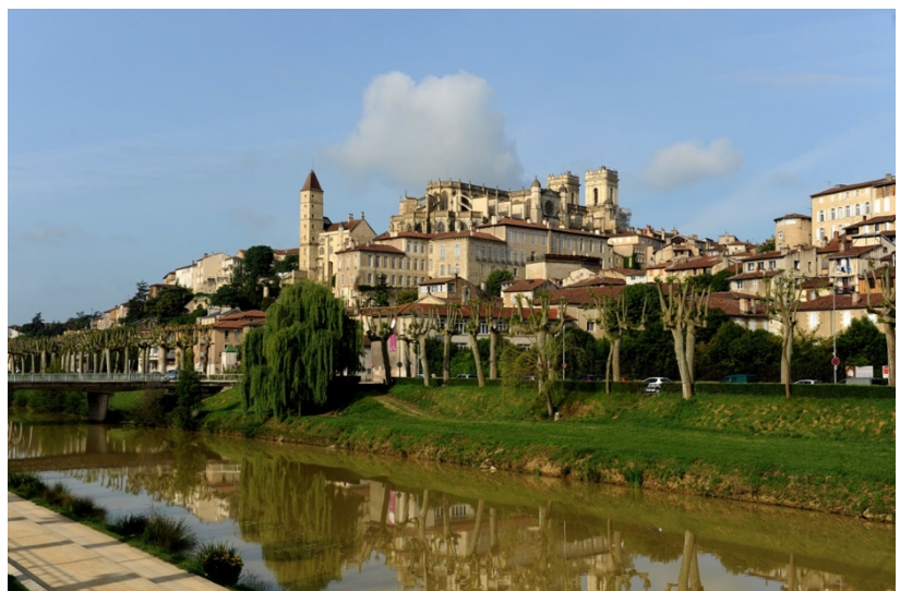
Foto: Paisagem de Auch caminho de Arles