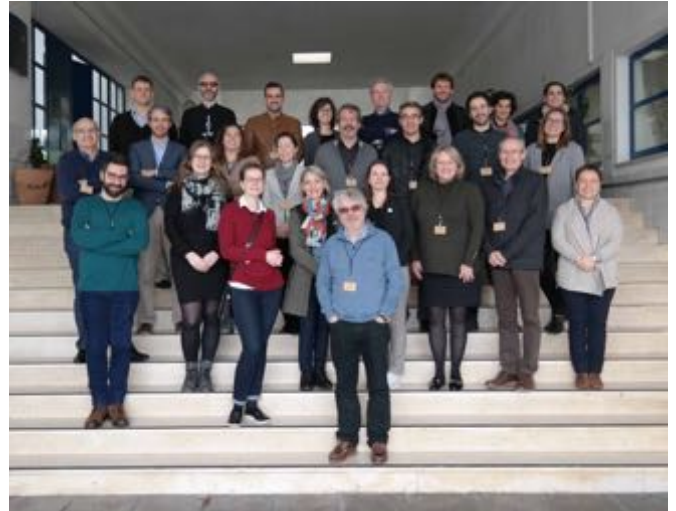
Foto del team di progetto al Kick-off meeting di Lisbona (IMPACTOUR)

Durante i due giorni dell'incontro tutti i partner hanno presentato e discusso il programma di lavoro, assicurando un buon avvio del progetto triennale. All'insaputa di tutti noi, il nostro incontro di fine gennaio sarebbe stato l'ultimo incontro faccia a faccia fino ad oggi, a causa della pandemia di COVID-19 che si è verificata in Europa nei mesi successivi. Per tutti noi il Coronavirus ha stravolto la nostra quotidianità e la nostra routine lavorativa ma il progetto continua, anche se con una necessaria modifica contrattuale per consentire ulteriori 6 mesi per adattare il piano di lavoro alla nuova situazione.