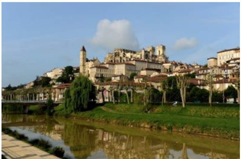
Photo: Paysage Auch chemin d'Arles @ ACIR Compostelle. JJ Gelbart.