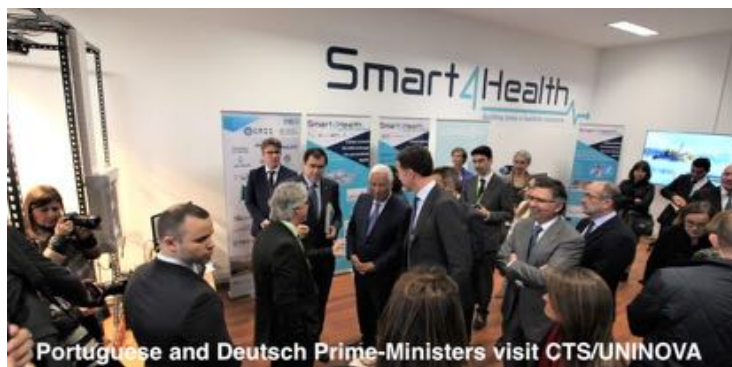
Portuguese and German Prime-Ministers visit CTS/UNINOVA

El objetivo principal de UNINOVA es buscar la excelencia en la investigación científica, el desarrollo técnico, la formación avanzada y la educación. Trabajando en estrecha colaboración con la industria y las universidades, las innovaciones tecnológicas se transfieren a conceptos empresariales rentables y, los productos existentes se desarrollan aún más para adaptarse a los nuevos requisitos industriales. Debido a su estrecha conexión con la Universidad y Madan Parque, UNINOVA ha acogido y apoyado desde su fundación el desarrollo de varias tesis doctorales, así como la creación de varias empresas de éxito.