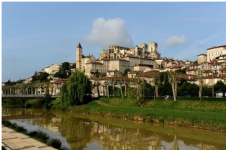
Panorama de Auch chemin d'Arles